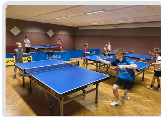
Im TT-Raum unterm Hallenbad geht es rund

Samstag: 18.00 – 19.30 bzw. 20:30 (1 & 2 MS bis 19:30, ab 3 MS bis 20:30)